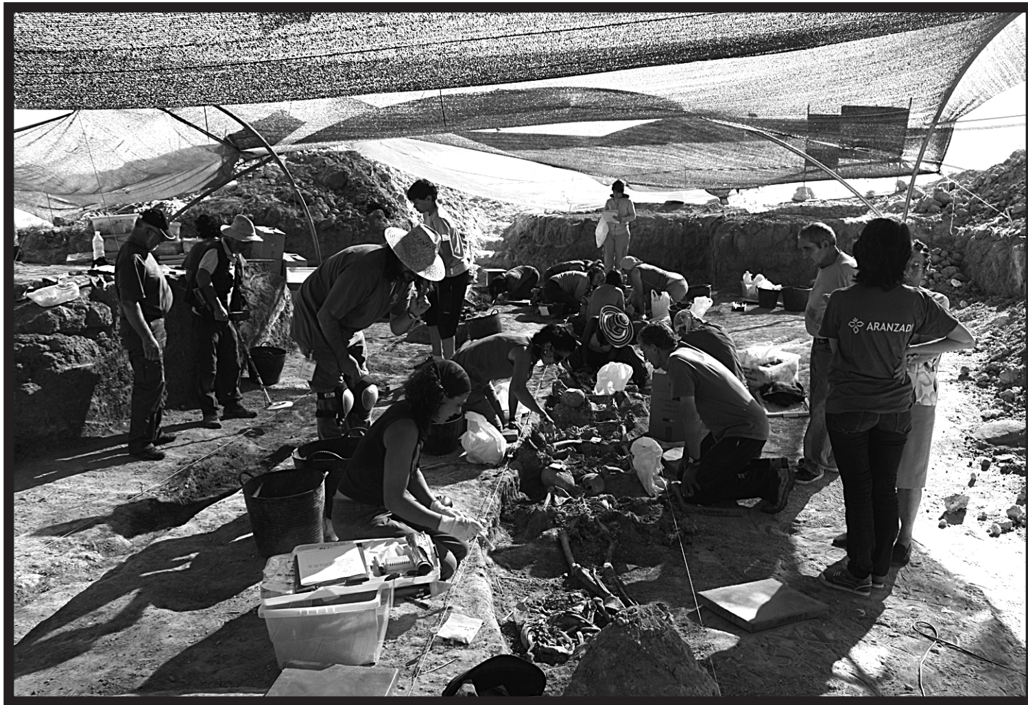
Pasa den udan Burgoseko Milagros herrian aritu ziren gorputzak lurpetik ateratzen. Orotara, 30 gorputz aurkitu zituzten. GAUR8

horietakoa, lasaitasunez aztertu behar dela uste dut. Baina Trantsizioa egin zutenek ere ezin dute esan bere espiritua hausten ari direla orain. Fase berri bat da hau, aktore sozial berriak daude, beste belaunaldi batzuk daude, beste kultura politiko bat. Ezin da eskatu guztiek orain 30 urte egin zena itsu-itsuan txalotzea; zalantzan jar daiteke. Hori ari da gertatzen bai hemen bai beste leku batzuetan ere.