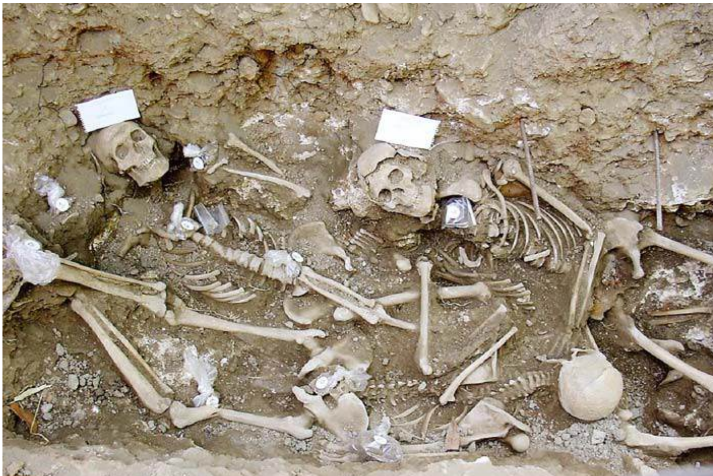
En cada fossa que s'obre la imatge es repeteix: ossos escampats, uns sobre els altres. Restes de bales, objectes personals...

adreces: www.memoriacatalunya.org ; http://coordinadora-victimtas.blogspot.com ].