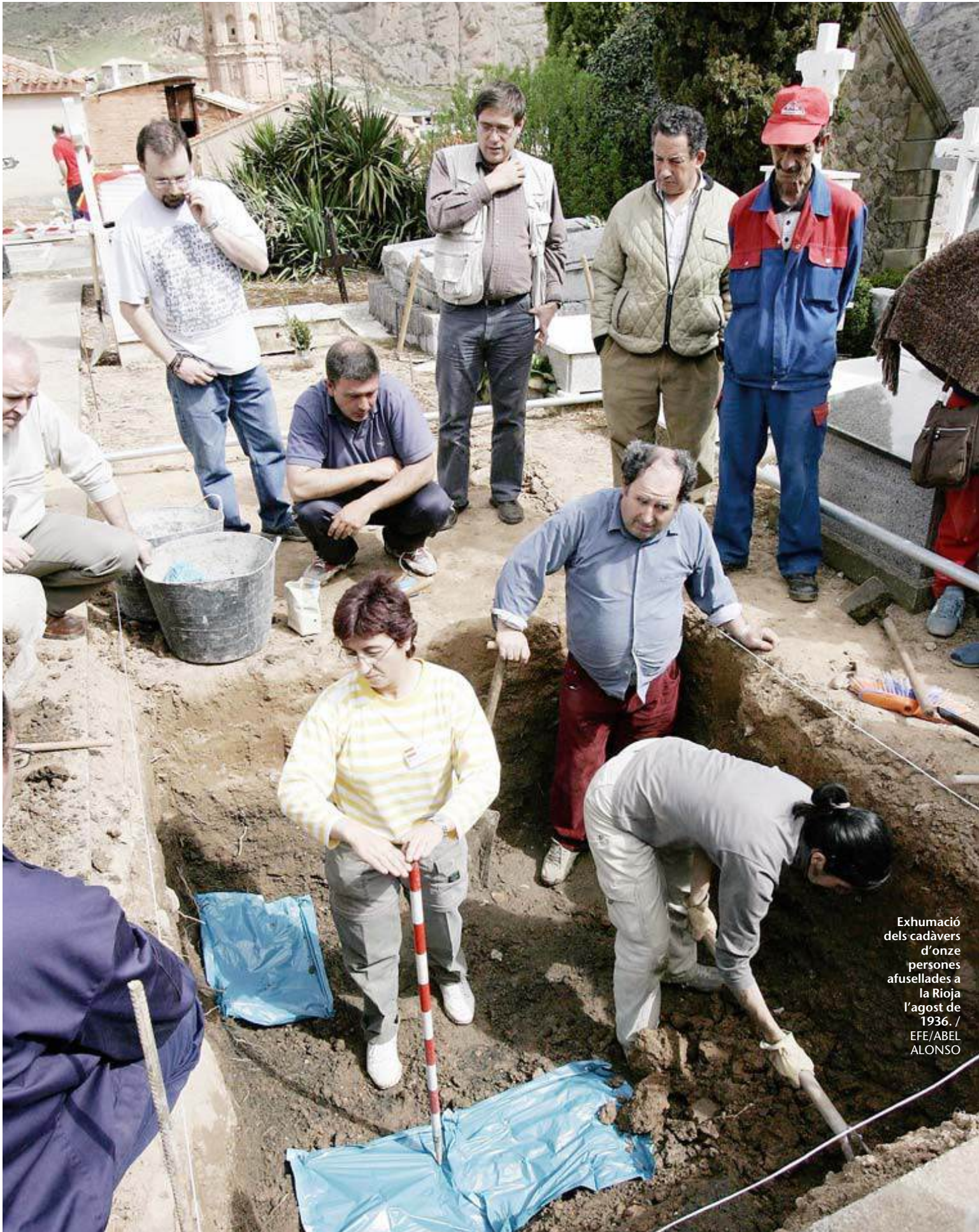
Exhumació dels cadàvers d'onze persones afusellades a la Rioja l'agost de 1936.