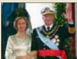
Dronning Sofia og kong Juan Carlos.

■ I 2007 vedtok den spanske nasjonalforsamlingen en lov der Francos kupp og nesten 40 år lange diktatur for første gang blir offisielt fordømt. Loven om historisk minne innebærer at alle symboler fra Franco-tiden