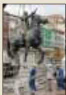
Franco-statue fjernes i byen Santander, desember 2008