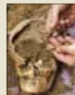
Gravåpning i byen As Pontes, 2006

skal fjernes fra gater og bygninger, og at lokale myndigheter skal finansiere gjenåpning av massegraver. I tillegg erklærer loven at de militære, summariske straffesakene som førte til at tusener av Francos fiender ble fengslet og henrettet, er ugyldige.