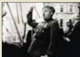
Generallissimo Francisco Franco.

■ 16. februar 1936 vant den venstreorienterte Folkefronten valget.