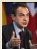
Statsminister José Luis Rodríguez Zapatero

■ Etter Francos død åpnet hans utpekte etterfølger, kong Juan Carlos, for demokratiske reformer.