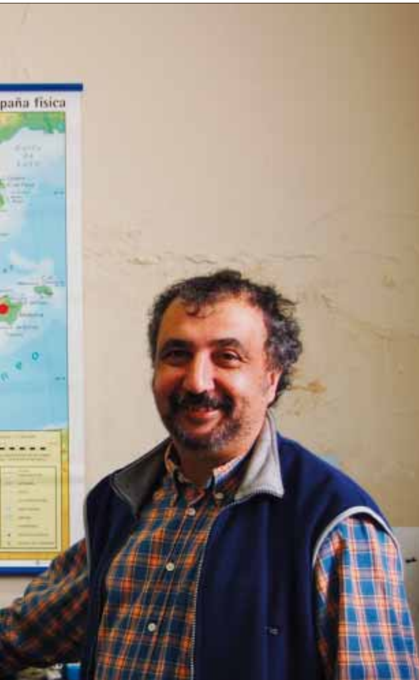
meningsfylt jobb, sier han. Spaniakartet i bakgrunnen viser kartlagte og åpnete massegra-