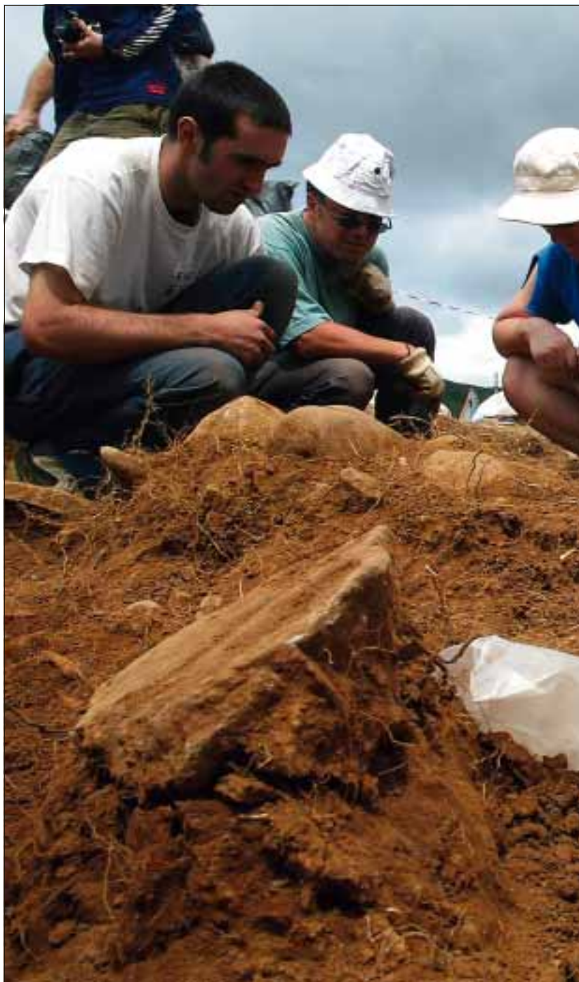
DUGNAD: Frivillige fra Foreningen for å gjenvinne det historiske minnet (ARMH) jobber med å

I etterkrigstida ble mange massegraver åpnet av Francos folk. Falangiste-