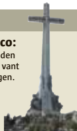
På Francos grav

Det nye demokratiet som vokste fram etter Francos død hadde store mangler. Det var ikke folket som kjempet fram endringer, men Francos utpekte arving kong Juan Carlos og hans allierte som la om systemet. Kompromissene var mange, og nedfelt både i amnestiloven av 1977 og den nye grunnloven av 1978. I praksis fikk alle overgriperne fra Franco-perioden amnesti.